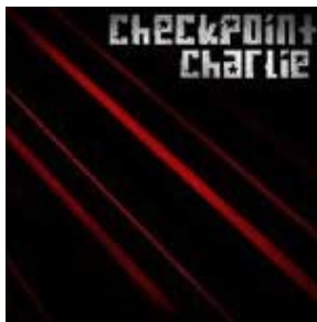
CHECKPOINT CHARLIE /2007/ EP

www.checkpointcharlie.hu - myspace.com/checkpointcharliemusic info@checkpointcharlie.hu - booking@frisk.hu